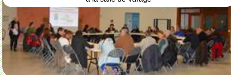
ANIMATIONS 9 FÉV. Réunion de préparation de la Journée Citoyenne à la salle de Varage