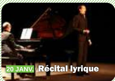
20 JANV. Récital lyrique