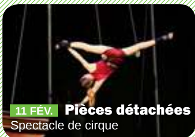
11 FÉV. Pièces détachées Spectacle de cirque