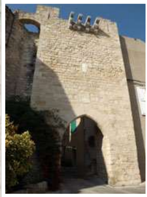
La Tour Sud

Naturellement, cela ne se fera pas du jour au lendemain. Mais l'implication et les efforts de chacun, y compris le bénévolat de la Journée Citoyenne, permettront de faire revivre peu à peu ce patrimoine exceptionnel et de le transmettre dans les meilleures conditions possibles aux générations futures.