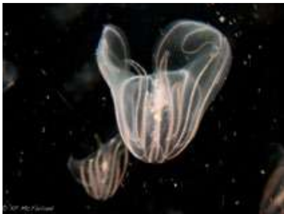
« la noix de mer » ou « Mnemiopsis leidyi »

Le GIPREB, Gestion Intégrée, Prospective et Restauration de l'Étang de Berre, a pour vocation de coordonner la reconquête de l'étang de Berre. Ses diverses études et actions permettent notamment d'améliorer la connaissance du milieu, de définir des objectifs de qualité, d'accompagner le développement des usages et d'orienter les actions de réhabilitation. À ce titre, le GIPREB est