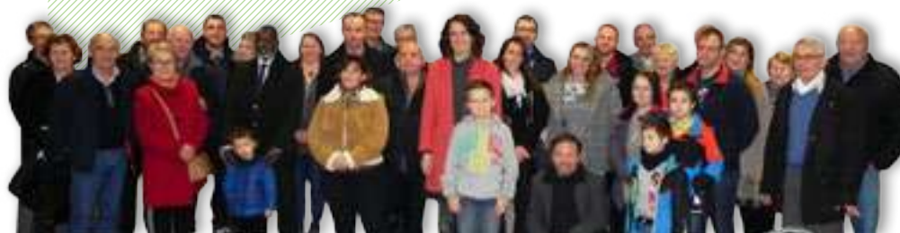
CÉRÉMONIE 7 FÉV. Accueil des nouveaux arrivants à La Manare