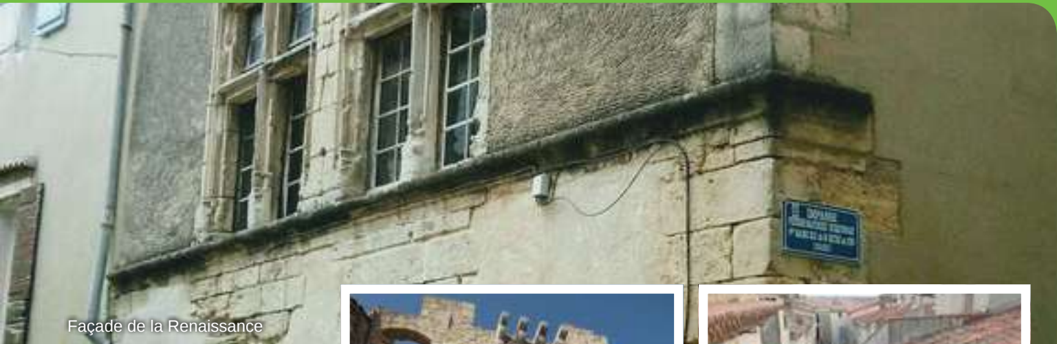
Façade de la Renaissance

Naturellement, cela ne se fera pas du jour au lendemain. Mais l'implication et les efforts de chacun, y compris le bénévolat de la Journée Citoyenne, permettront de faire revivre peu à peu ce patrimoine exceptionnel et de le transmettre dans les meilleures conditions possibles aux générations futures.