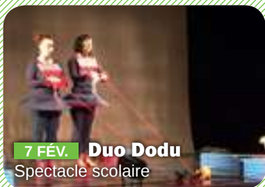
7 FÉV. Duo Dodu Spectacle scolaire