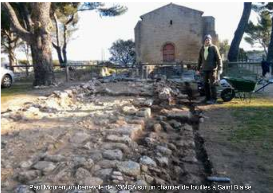
Paul Mouren, un bénévole de l'OMCA sur un chantier de fouilles à Saint Blaise