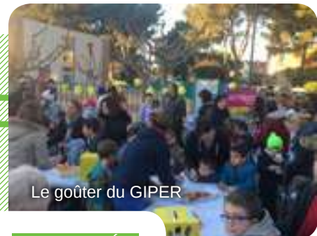
Le goûter du GIPER