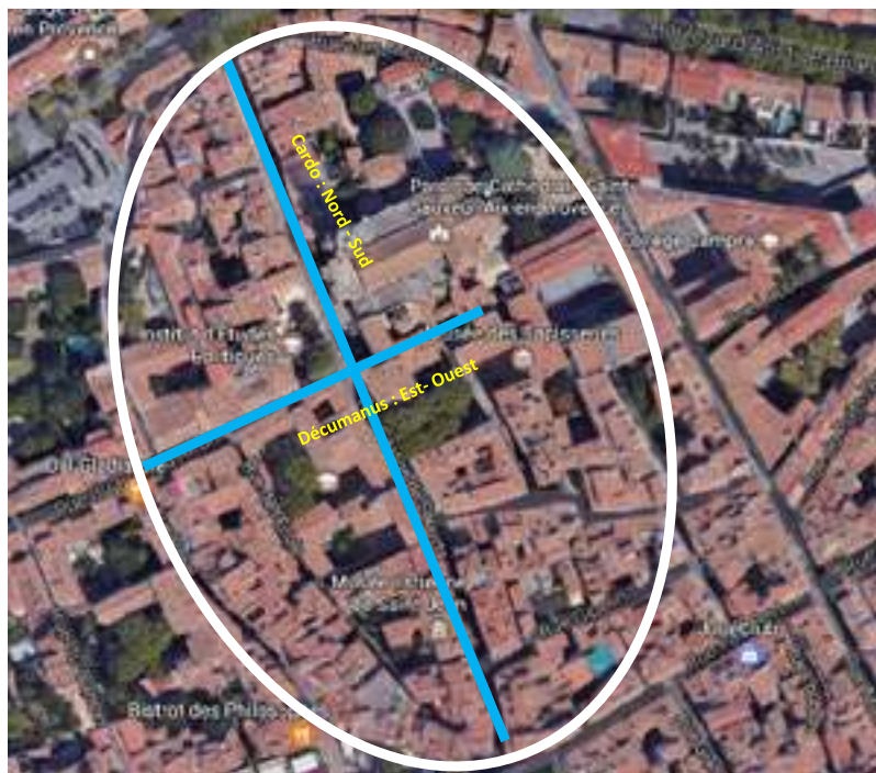
Le Bourg Saint Sauveur d'Aix, la ville romaine du 1 er siècle avant JC, a une forme ovoïde et un croisement de deux axes principaux Nord-Sud et Est-Ouest.