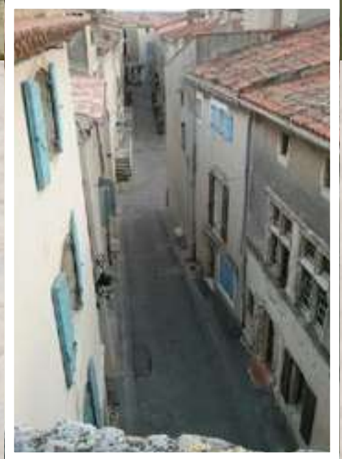
Vue de la Tour Nord