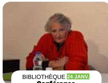
BIBLIOTHÈQUE 24 JANV. Conférence Maria de Magdala et la Ste Baume