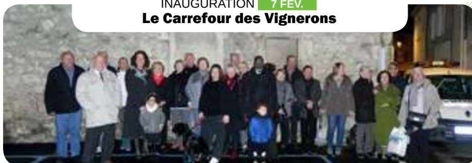
INAUGURATION 7 FÉV. Le Carrefour des Vignerons