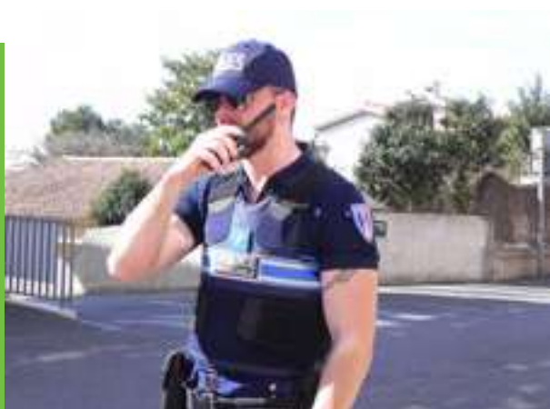
Le système de radiocommunication est opérationnel

A terme, la commune sera dotée de 48 caméras en tout.