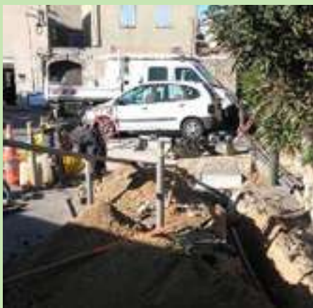
Travaux d'installation de réseaux de fibre optique

Les 10 « armoires de rue » qui permettront de desservir l'ensemble de la commune ont été installées par la société CIRCET pour le compte de SFR, responsable de la construction du réseau très haut débit sur notre commune.