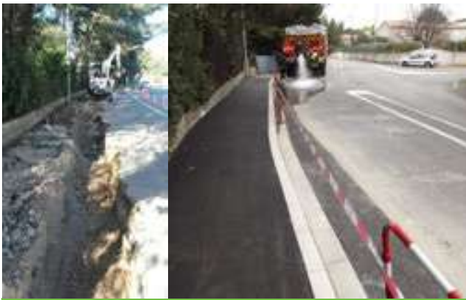
Travaux d'aménagements pluviaux sous trottoir chemin des Calieux par l'entreprise Eurovia.