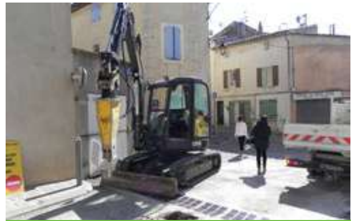
Travaux d'enfouissement des réseaux d'énergie électrique (ERDF et France Telecom) par le SMED13 : rue Bellefont (voir photo), rue des Paillères et la rue du Plan de Bagnère, rue Marotte et voies attenantes.