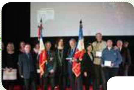
CÉRÉMONIE 4 JANV. Les Vœux du Maire à la population