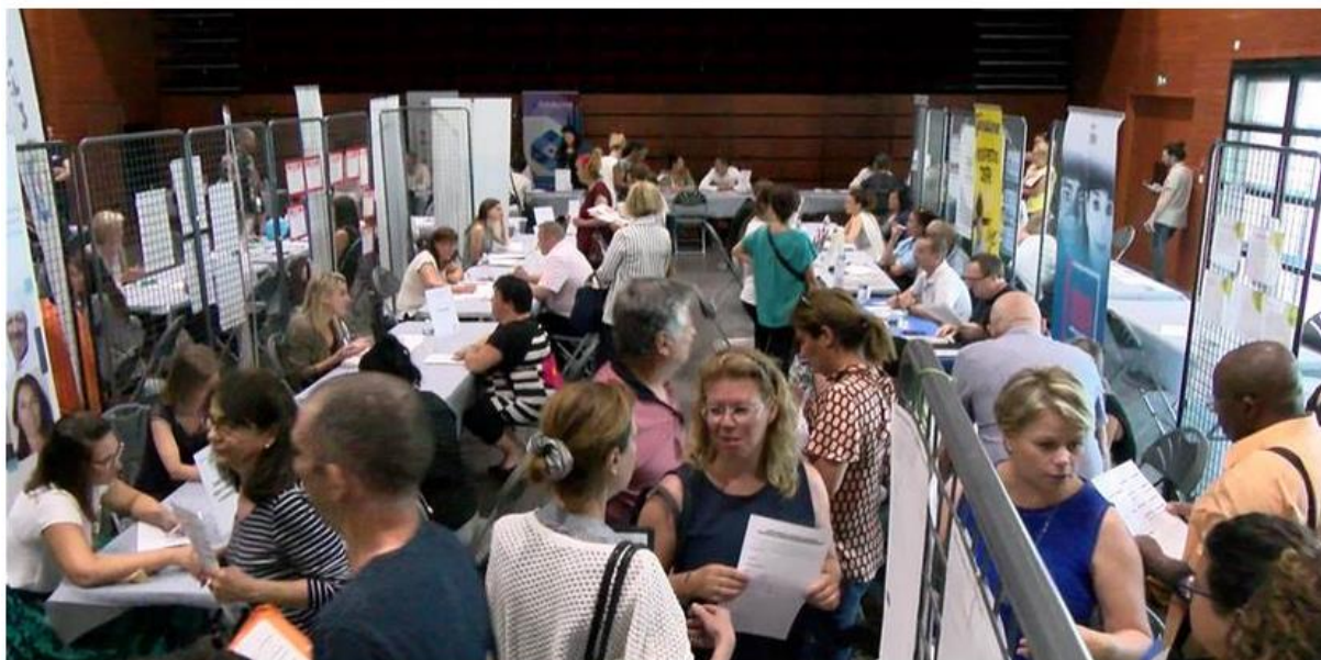
1/1 Saint-Mitre : le forum-emploi toujours en vogue