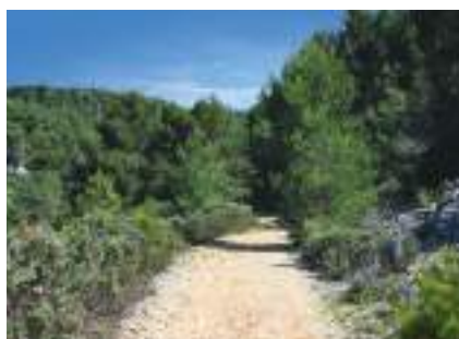
Chemin forestier à Saint-Julien-les-Martigues