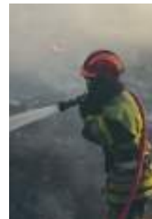
Extinction des derniers foyers par noyage après la maîtrise du feu. Cette opération fastidieuse est indispensable et peut prendre plusieurs jours

connaissent parfaitement le territoire, notamment l'emplacement des maisons isolées, des zones sensibles et des établissements recevant du public.