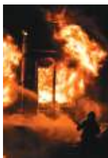
En août 2020, certaines habitations n'ont pas pu être sauvées

Sur le terrain, sur demande spécifique des Moyens de lutte (pompiers, forces de l'ordre), les partenaires et les bénévoles engagés sont mobilisés pour le guidage des secours, la reconnaissance des mouvements de feu et l'indication de la dangerosité. Leurs actions permettent aux secouristes et aux pompiers de se consacrer aux missions complexes, dangereuses ou urgentes.