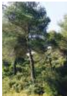
Avant / après une éclaircie en forêt

À Martigues, l'équipe « Forêt-Arbres en ville » complète ces actions par des visites auprès des habitants, des campings et des acteurs économiques, pour des conseils en élagage et un accompagnement dans la mise en protection des biens.