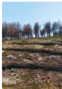
Fascines sur la Côte Bleue

Les sociétés de chasse interdisent la pratique pendant au moins un an, jusqu'au retour de la faune et de la flore. L'expertise des chasseurs contribue aux décisions grâce à leur connaissance précise du biotope et des modes de vie de la faune. Ils élaborent des aménagements destinés à apporter nourriture et abris aux animaux. + d'infos : fdc13.fr