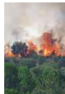
Le 4 août 2020, la lutte contre les flammes a duré 13h. L'extinction et la surveillance, plus d'une semaine

les habitants de Port-de-Bouc sont mis en sécurité à la salle Gagarine, centre d'accueil des sinistrés.