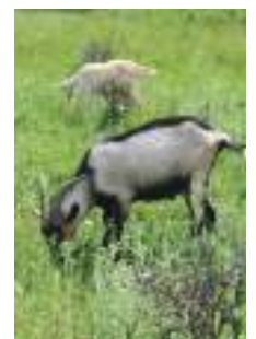
L'éco-pâturage participe à l'entretien des forêts

Les bénévoles des Comités Communaux Feux de Forêt sont dévoués à la protection des massifs. En 2020, à Saint-Mitre-les-Remparts, ils ont effectué 708 h de patrouille