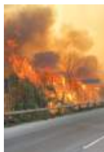
Départ de feu en bord de route