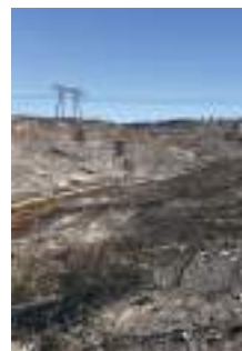
Collines de la Côte Bleue, août 2020