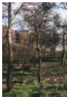
Hiver 2021, étendue de la repousse sous les arbres après 7 mois