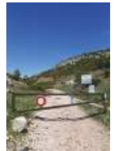
Barrière d'accès aux pistes DFCI