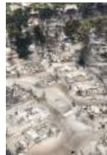
Camping des Tamaris vu du ciel août 2020