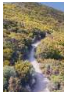
Paysage de garrigue

Parfaitement adapté au sol calcaire et au climat méditerranéen, il a l'avantage de se reconstituer après un incendie grâce au rejet sur branche. Comme d'autres feuillus, tels le chêne pubescent, l'éraable ou le frêne à fleurs..., il survit grâce à son système racinaire préservé.