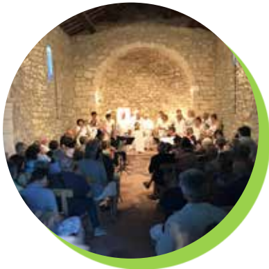
La fête de la Saint Jean avec Chante Lyre