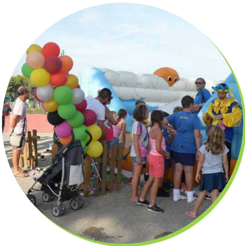
La fête des associations