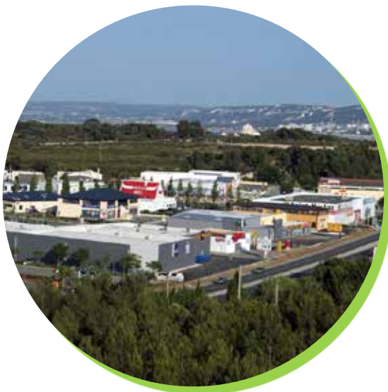
ZAC des Étangs