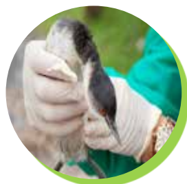
Grèbe à cou noir