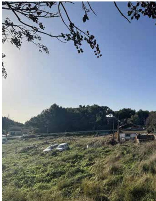
Les parcelles se situent en bas du parking de la mairie.

La municipalité rappelle ainsi sa volonté de préserver des finances communales équilibrées.